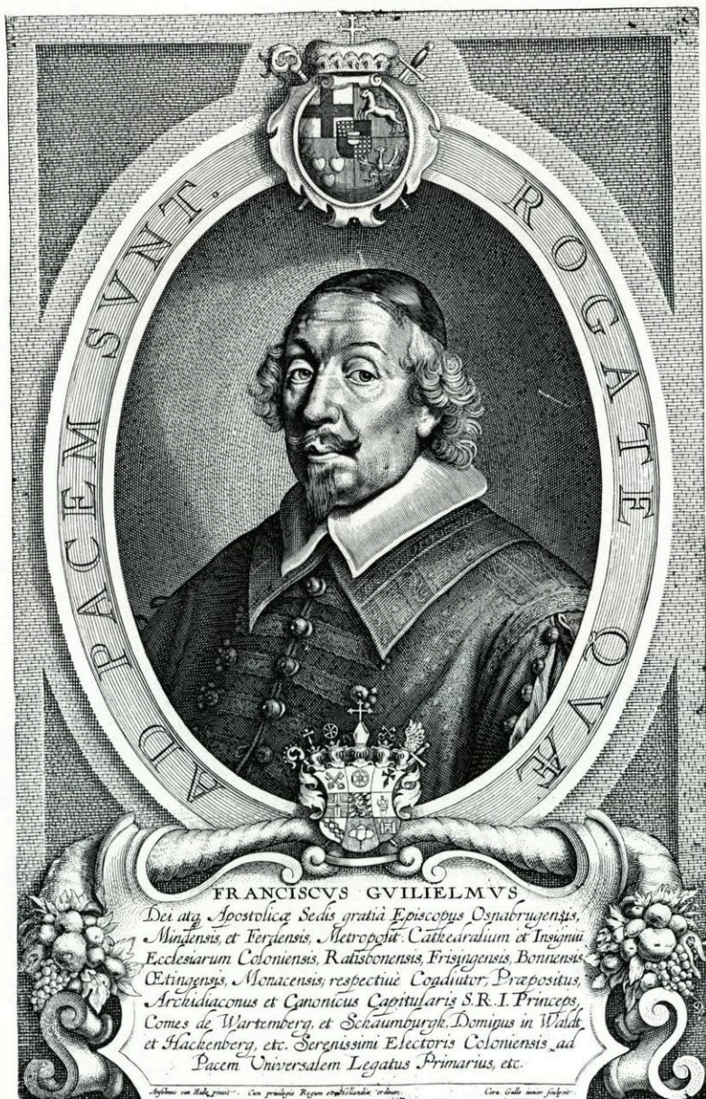
Franz Wilhelm Kardinal Graf von Wartenberg Fürstbischof von Regensburg (1649–1661)